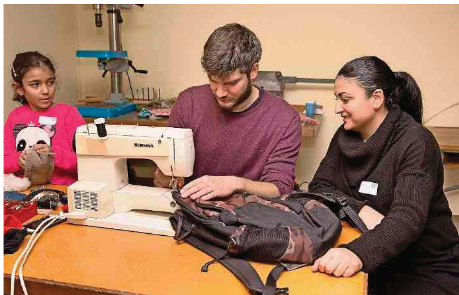
Hier darf der Reporter – unter Anleitung – noch selber probieren.

Gegenstände konnten am Samstag im «Repair Café» Olten ganz oder teilweise geflickt werden. 80 defekte Dinge – vorwiegend aus den Bereichen Textil und Elektronik – wurden vorbeigebracht. Wer das Angebot vergangenen Samstag verpasst hat, hat im kommenden Jahr wieder Gelegenheit zur kostenlosen Reparatur: Geplant sind bereits zwei bis drei weitere Daten.